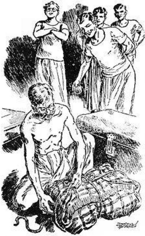
শিশির সিগারেটের টিনটা এগিয়ে ধরে জিজ্ঞাসা করে..... [ পৃঃ ৯০