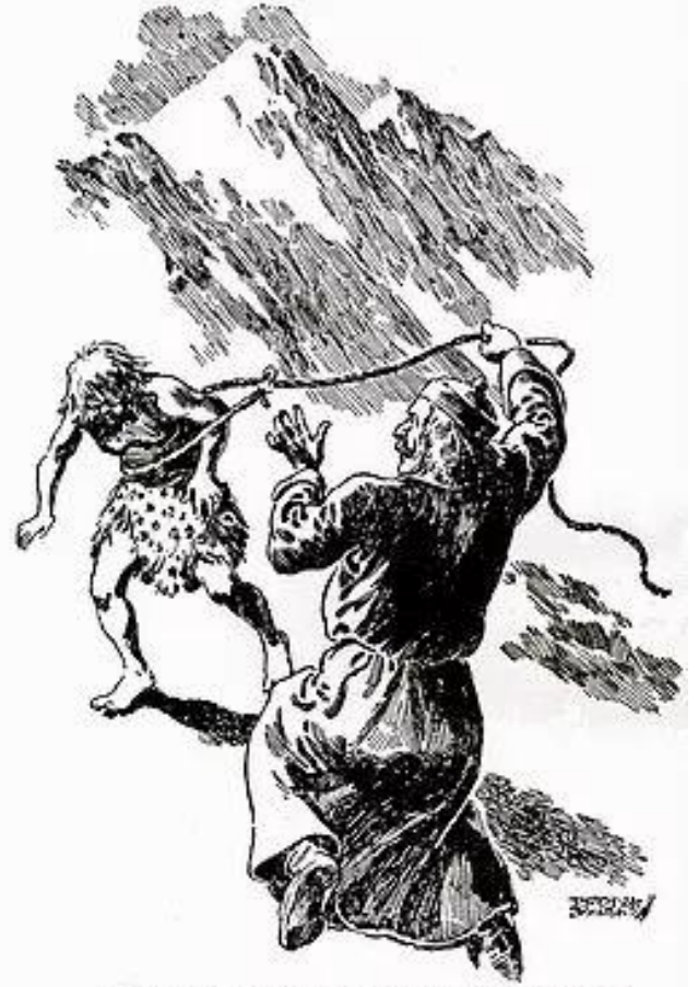
বিছাৎ-গতিতে 'লাসো'র দড়ির ধাঁস গিরে 'ইয়েতি'র কোমরে আটকে গেল। [ পৃ: ৪৩১