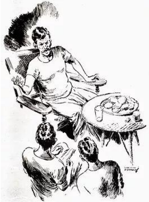
'চালবাড়ি ত করত, মানে জান এসব কথার ?'