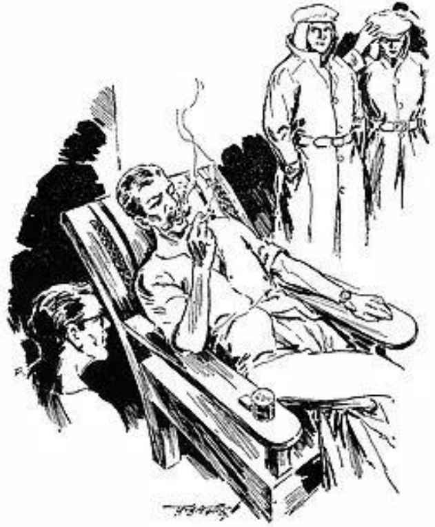
তোমরা বেরুচ্ছ এখন !