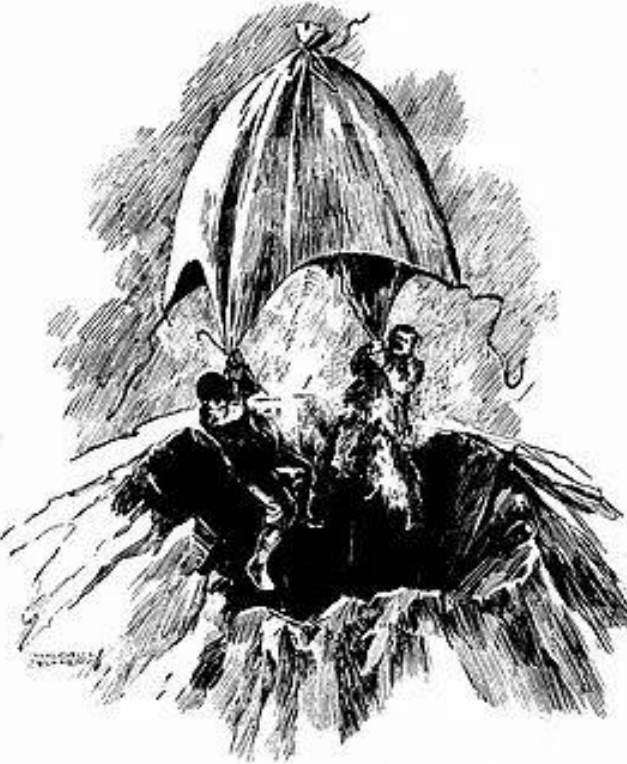
হাওদায় হেসে ডুবা থেকে বেরিয়ে এলাদ। [ পৃ: ৪২৬